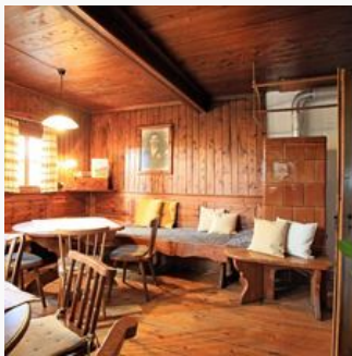
15-23 Personen · 1 soveværelse